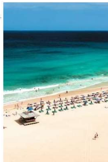
Températures moyennes en journée

Tui Ds Lanzarote-Tenerife Calle Garaionav, 18 Puerto Del Carmen - Lanzarote 35510 Tél. 00 34 922 71 74 24