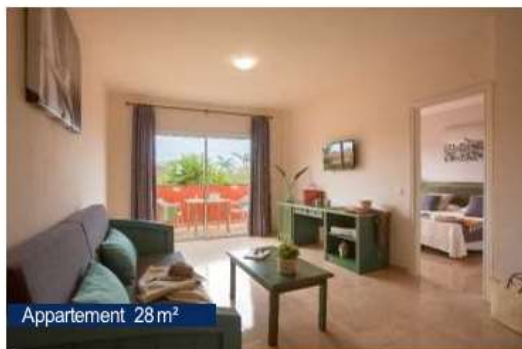
Appartement 28m 2