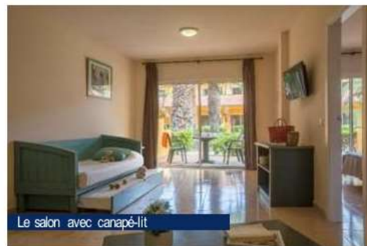
Le salon avec canapé-lit