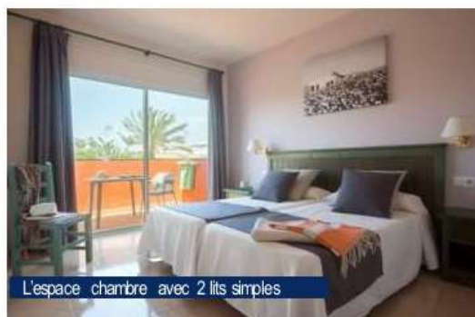
L'espace chambre avec 2 lits simples

Appartement double, triple ou familial (28 m 2 )* : agréable et spacieux, aménagé avec téléphone, télévision, mini-réfrigérateur, carrelage, salle de douche avec sèche-cheveux. Balcon ou terrasse. Coffre-fort payant. Tous les appartements disposent d'une chambre avec 2 lits simples et un salon avec canapé-lit.